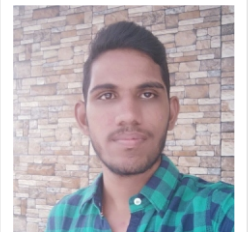
ஜெ. ஜவஹர் மன்னார்குடி