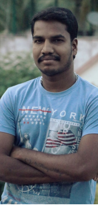
அன்பு.பாரி வள்ளல் மன்னார்குடி

சிறகடித்து பறக்க வேண்டிய... சிறகொடிந்த சின்னஞ் சிறார்களும்!