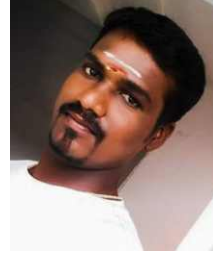
S.S. கார்த்திக், DME உள்ளிக்கோட்டை

வாழ்க்கைக்கு வழிகாட்டியாய் திகழ்பவள் அவள்! என் வாழ்க்கையை வசந்தமாக்கியவள் அவள்! என் உயிருக்கு உருவம் அவள்!