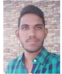
~ ஜெ.ஜவஹர் மன்னை