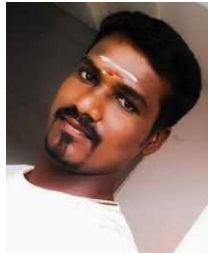
S.S. கார்த்திக், DME உள்ளிக்கோட்டை