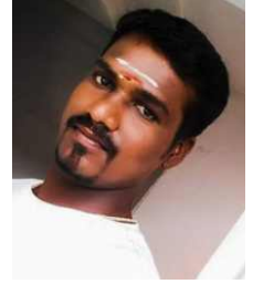
S.S. கார்த்திக், DME உள்ளிக்கோட்டை