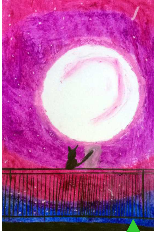
மாயா முரளி Indooroopilly state school, Brisbane