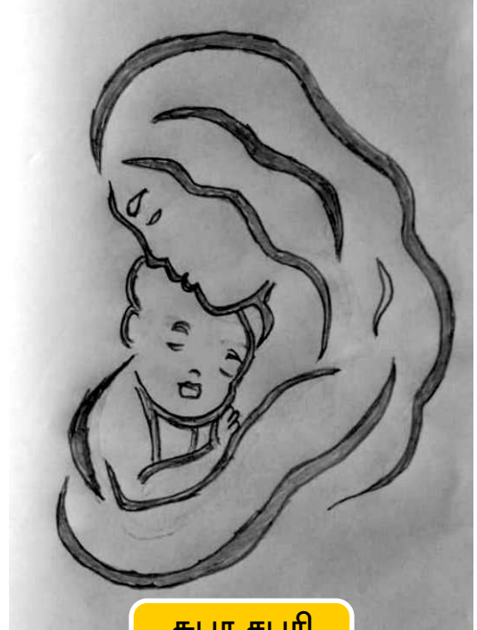
சுபா சபரி மன்னார்குடி