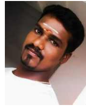
S.S. கார்த்திக், DME உள்ளிக்கோட்டை