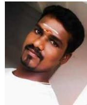
S.S. கார்த்திக், DME உள்ளிக்கோட்டை