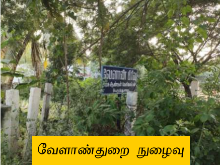
வேளாண் துறை நுழைவு