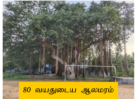
80 வயதுடைய ஆலமரம்