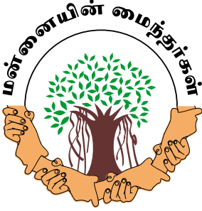
மன்னின் மாற்றத்தை நோக்கி

மாற்றங்களை பிறரிடம் எதிர்பார்க்காமல் எம்மிடம் இருந்து ஆரம்பிக்க வேண்டும் என எண்ணிய பல எளிய மக்கள் ஒன்று சேர்ந்து டிசம்பர் 26, 2014ம் தேதி முகநூலில் மன்னையின் மைந்தர்கள் குழு ஆரம்பித்து இன்று 4966 முகநூல் நட்புகளுடன் தொடர்ந்து பயணிக்கிறது.