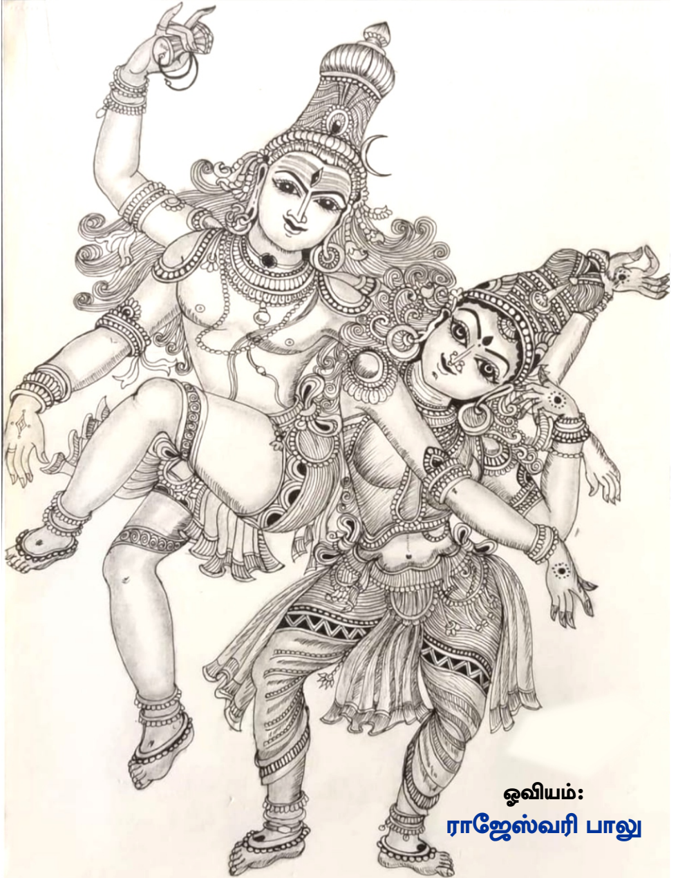
ஓவியம்: ராஜேஸ்வரி பாலு